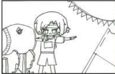
6年1組 阿部 菜緒