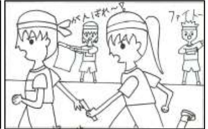
6年1組 池永 実南