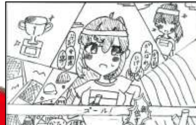
6年3組 後藤 美空