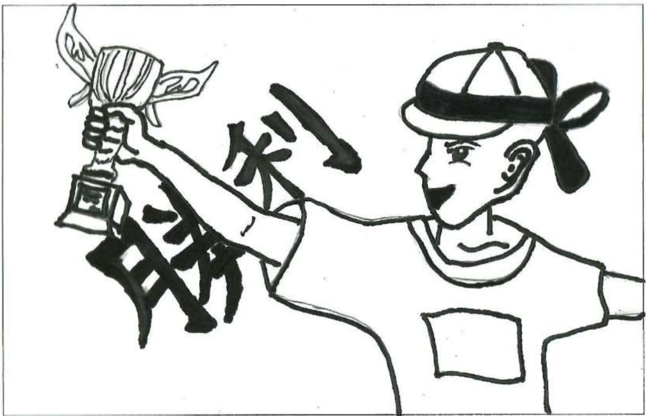
絵 6年2組 石橋 煌史