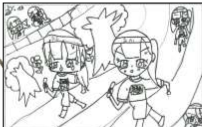
6年3組 中村 蒼空